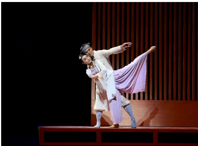
書生寧采臣夜宿寺廟，巧遇小倩，一見鍾情。 小倩感其正直，為其真情所動，不願加害。