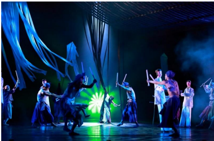
嘈雜紛亂的盂蘭節市集，讓寧采臣無所適從。