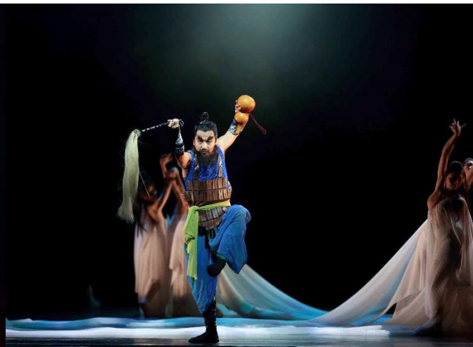
俠客燕赤霞隱居於蘭若寺，暗中保護旅人。