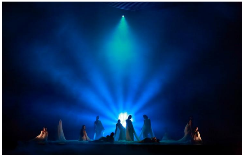
美若天仙的幽魂勾引旅途中的男人。