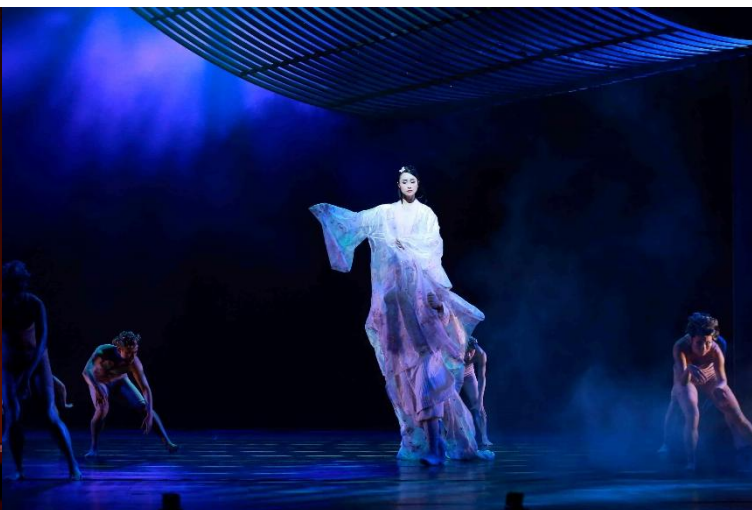
小倩違抗樹妖，受盡折磨。她假意對寧采臣怒斥 相向，趕走他免受樹妖加害。