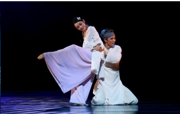
愛慕之情促使二人衝破層層障礙，相擁一起。