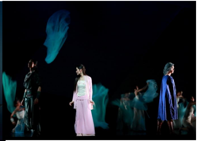
雄霸深信神相泥菩薩的批言，處心積慮分化風雲二人，利用孔慈令他們備受友情與愛情的考驗。