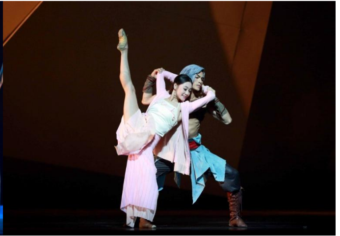
情竇初開的雄霸養女孔慈，與聶風和步驚雲形成三角關係。