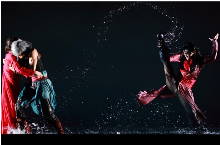
聶風與步驚雲展開決鬥，孔慈為救聶風，意外被步驚雲致命一擊，重傷而死。